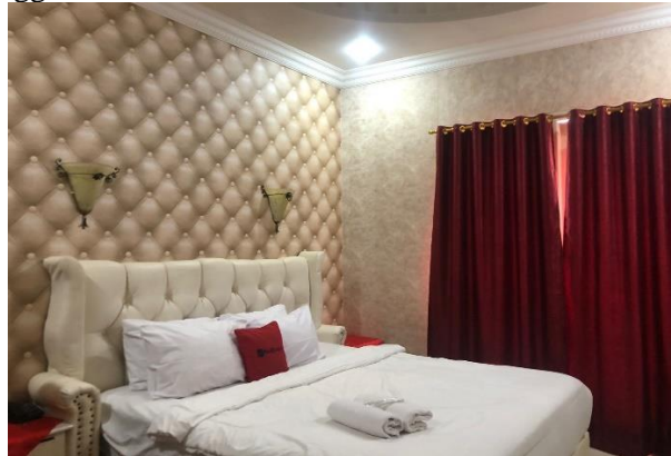
Gambar 5. Bed Sweet Room

rapi dan wangi sebagai produk yang dapat memenuhi harapan pelanggan ( expected product ) sehingga dapat menambah kenyamanan pengguna kamar hotel.