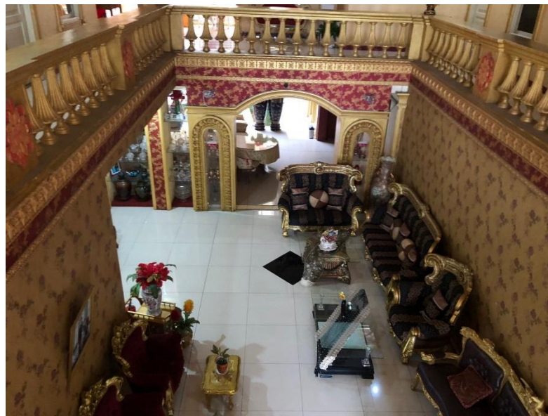
Gambar 2. Ruang Tunggu