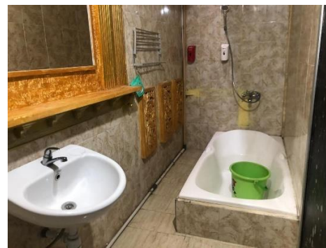
Gambar 7. Bathub, Westafel dan kaca