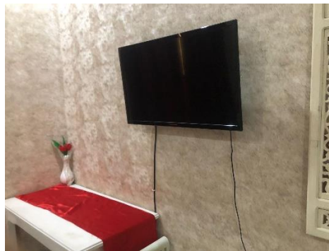
Gambar 6. Televisi