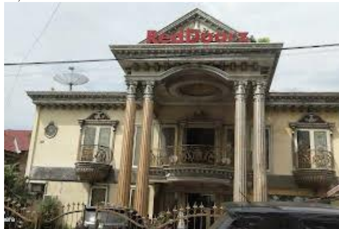
Gambar 1. Hotel/penginapan Reddoorz Jalan Ahmad Yani

Pada kisaran awal tahun 2020, dengan kesiapan yang matang pemilik hotel mengubah kostannya menjadi hotel/penginapan syariah yang sudah berlisensi dan ditanda tangani diawal kontrak bersama pihak reddoorz. Sehingga merubah dan menteapkan nama hotel/penginapan ini menjadi Reddoorz Syariah Jalan Ahmad Yani. Bersamaan dengan itu, hotel ini mulai memperluas kamar menjadi 25 kamar dan membuat bagian kamar menjadi pilihan sesuai kebutuhan pengunjung seperti ada pilihan kamar Sweet Room, Premium, dan Standar.