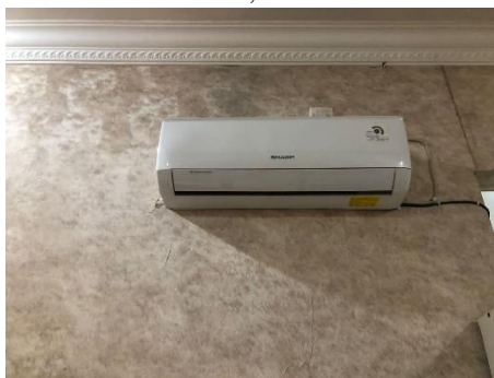
Gambar 9. Air Conditioner

Selain yang tertera diatas semua kamar dengan ukuran apapun disediakan kamar mandi di dalam, sehingga membuat pengunjung yang menginap tidak perlu keluar kamar untuk sekedar buang air dan mandi. Diluar include fasilitas hotel, pemilik juga menyediakan dapur untuk pengunjung yang menginap tetapi tidak menyediakan sarapan pagi, makan siang, dan makan malam, jadi pemilik hanya menyediakan menu yang akan di pesan pengunjung sesuai yang tertera di menu dan diluar harga reservasi kamar. Fasilitas laundry yang membantu pengunjung yang tidak sempat untuk mencuci baju juga disediakan di hotel ini, namun untuk biayanya diluar include reservasi kamar.