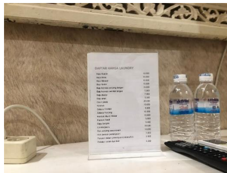
Gambar 10. Daftar harga Laundry