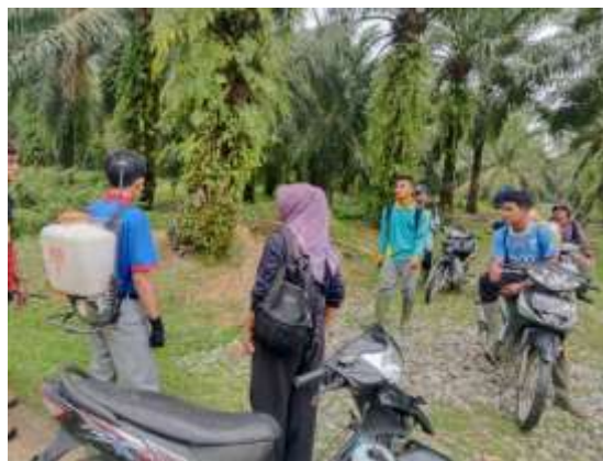
Gambar 1. Tim PkM Mengecek Pemberian Pestisida Terhadap Tanaman Sawit

Dusun I Bukit Gantung, Desa Sumber Mulyo, memiliki perkebunan kelapa sawit dengan luas sekitar 50 hektar yang menjadi sumber mata pencaharian utama masyarakat setempat. Berdasarkan hasil wawancara dengan Kepala Dusun, diketahui bahwa selama ini petani melakukan penyemprotan pestisida secara besar-besaran tanpa membedakan jenis penyakit. Setiap musim tanam, rata-rata digunakan 2 liter pestisida per hektar, sehingga untuk keseluruhan lahan 50 hektar mencapai sekitar 100 liter pestisida. Praktik ini menimbulkan dampak negatif terhadap lingkungan karena pestisida diberikan serentak ke semua tanaman meskipun tidak semua mengalami penyakit yang sama. Residu pestisida dapat mencemari tanah dan air, serta berpotensi membahayakan kesehatan masyarakat (Dhaifulloh et al., 2024).