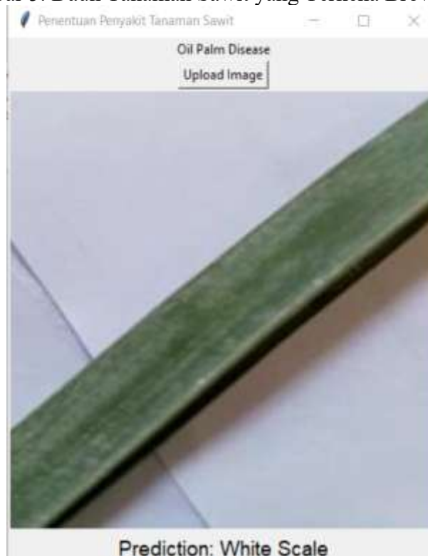
Gambar 6. Daun Tanaman Sawit yang Terkena White Scale