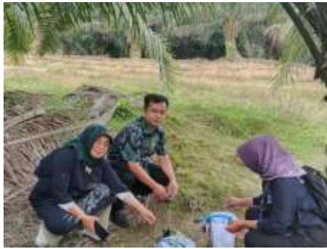
Gambar 2. Tim PkM Melakukan Instalasi IoT

Melalui kegiatan Pengabdian kepada Masyarakat (PkM) ini, tim pelaksana berupaya memberikan solusi berupa sosialisasi dan edukasi tentang pemanfaatan IoT berbasis machine learning dalam deteksi penyakit tanaman sawit. Kegiatan ini diharapkan mampu meningkatkan literasi teknologi pertanian di kalangan petani, mengurangi ketergantungan pada penggunaan pestisida berlebihan, serta memperkuat kesadaran akan pentingnya pertanian berkelanjutan. Dengan penerapan teknologi ini, petani tidak hanya dapat meningkatkan produktivitas, tetapi juga menjaga keberlanjutan ekosistem pertanian desa dan kesejahteraan masyarakat setempat.