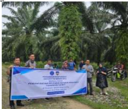
Gambar 3. Tim PkM Melaksanakan Kegiatan PkM

Preparation Stage ini berlangsung pada minggu pertama. Mitra berperan dalam penyediaan lokasi, peserta, dan sarana penunjang.