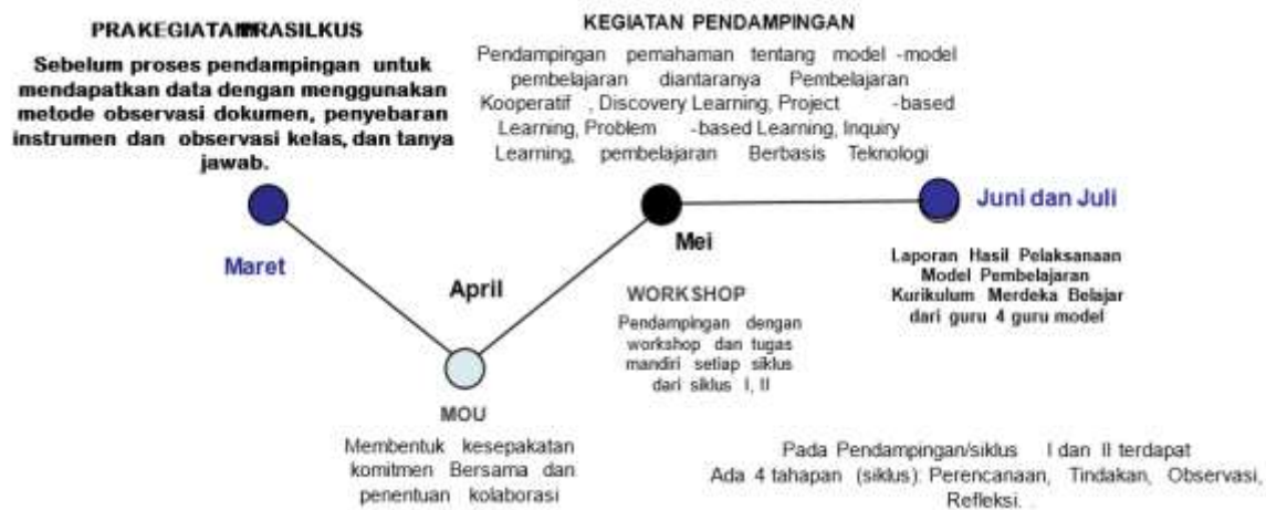
Gambar 3: Metode Pendampingan Secara Berkala

Jika diamati pada diagram diatas, maka pola pendampingan pada aspek operasional yang dilakukan oleh Tim Universitas Indraprasta PGRI diawali dengan memberikan pemahaman dan langkah-langkah pelaksanaan dan penjelasan pelaksanaan kelima siklus untuk meningkatkan keterampilan strategi pembelajaran kurikulum merdeka, Pemetaan dalam implementasi meningkatkan keterampilan strategi pembelajaran kurikulum merdeka dan langkah-langkahnya. Perencanaan dan strategi pembelajaran kurikulum merdeka dan langkah-langkahnya. Pelaksanaan pembelajaran kurikulum merdeka dan langkah-langkahnya, seperti monitoring, evaluasi mutu dan langkah-langkahnya, strategi mutu baru dan langkah-langkahnya sebagai berikut: