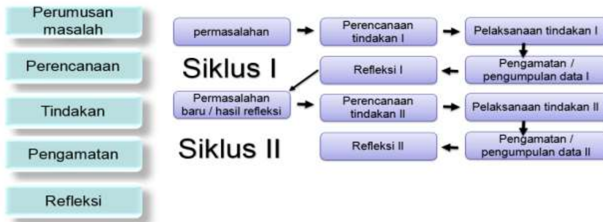
Gambar 2: Pola Pendampingan di SMPN 187 Jakarta

pendampingan ini adalah sekolah-sekolah yang ada dalam pembinaan sebagai sasaran pengabdian masyarakat di SMPN 187 Jakarta. Pemilihan sampel pendampingan adalah sekolah sasaran dari Abdimas semester genap tahun 2024. Pola penerapan yang dilakukan oleh Tim Universitas Indraprastaa PGRI dalam melakukan pendampingan sebagai berikut: