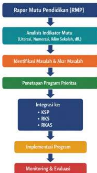
Gambar 2. Alur Pemanfaatan RMP dalam Perencanaan di UPTD SDN 2 Bati-Bati

Berdasarkan Gambar 2, terlihat bahwa RMP berfungsi sebagai sumber informasi awal dalam proses perencanaan berbasis data. Tahapan dimulai dari analisis indikator mutu, kemudian dilanjutkan dengan identifikasi masalah dan akar masalah melalui forum diskusi bersama guru. Setelah itu, sekolah menetapkan program prioritas yang selanjutnya diintegrasikan ke dalam KSP, RKS, dan RKAS. Program yang telah direncanakan kemudian diimplementasikan dan dimonitor secara berkala untuk memastikan ketercapaian indikator mutu.