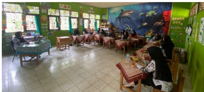
Gambar 1. Forum rapat bersama guru dan tim manajemen sekolah

Berdasarkan hasil wawancara mendalam dengan Kepala UPTD SDN 2 Bati-Bati serta analisis terhadap dokumen Kurikulum Satuan Pendidikan (KSP), Rencana Kerja Sekolah (RKS), dan Rencana Kerja dan Anggaran Sekolah (RKAS), diperoleh temuan bahwa sekolah telah menerapkan perencanaan berbasis data secara sistematis dengan memanfaatkan Rapor Mutu Pendidikan (RMP) sebagai sumber informasi strategis. Pemanfaatan RMP tidak hanya bersifat administratif sebagai dokumen pelengkap, tetapi benar-benar dijadikan dasar dalam proses pengambilan keputusan dan penyusunan program sekolah.