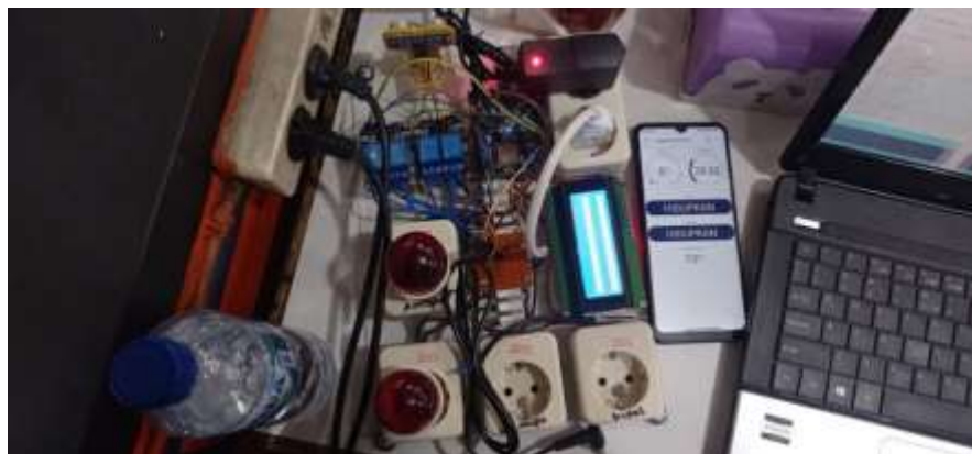
Gambar 4.1. Tampilan Prototipe

Tampilan prototipe secara keseluruhan diperlihatkan pada Gambar 3 berikut. Berdasarkan gambar tersebut seluruh komponen prototipe ditempatkan di atas selembar akrilik.