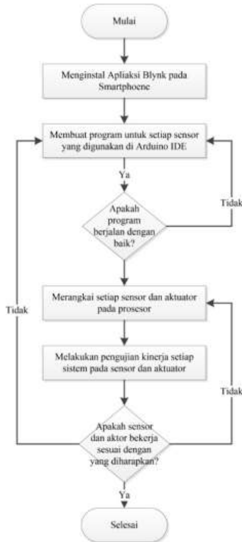
Gambar 1. Diagram Alir Tahapan Pembuatan Alat Rancangan

Metode pembuatan rancangan alat pengawasan dan pengontrolan kandang ayam pada program ini diperlihatkan pada Gambar 1. Tahapan perancangan alat ini dimulai dengan menginstal aplikasi Blynk IoT ke dalam smartphone yang dapat diunduh pada aplikasi Google Play Store secara gratis. Dari aplikasi Blynk IoT tersebut akan dikirimkan kode token ke alamat email pengguna.