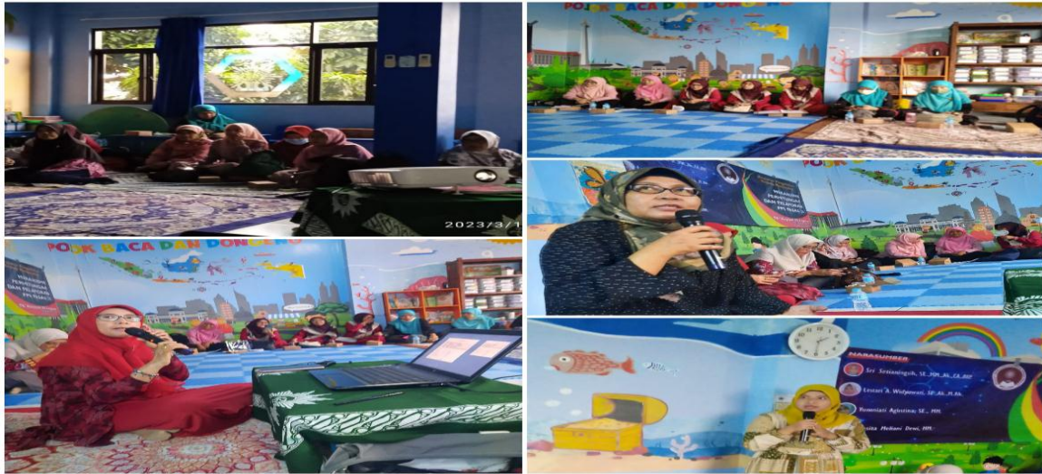
Gambar 2 : Foto Dokumentasi kegiatan PKM